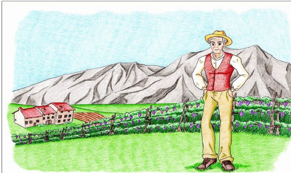
GEREMIA, IL CAPO DEI CONTADINI